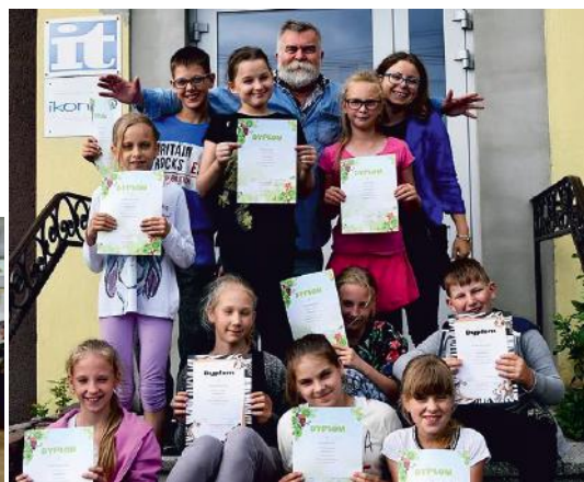
Materiały GOK Kaliska