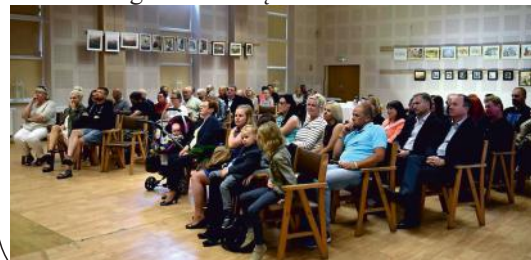
Materiały GOK Kaliska

muzyczne. Atmosfera spotkania była bardzo rodzinna, wśród zgromadzonych biegały rozbawione pociechy. Na gości czekał poczęstunek - domowej roboty ciasto, kawa, herbata i wino. Miłym zaskoczeniem było to, że wernisaż zgromadził się tak wielu ludzi.