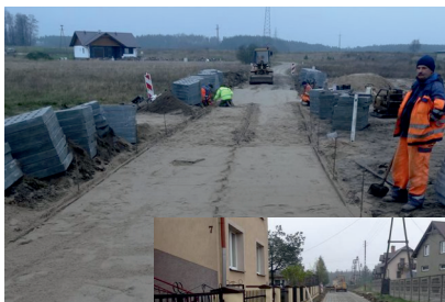
Ulica Wspólna Frank

☑ Kaliska - dokończono ulicę Leśną w kwocie 54.660zł oraz ulicę Sosnową w kwocie 50.833zł. Obie ulice wykonano z płyt yomb.