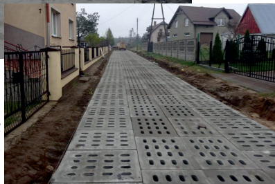
Ulica Sosonowa Kaliska

☑ Dąbrowa - utwardzono częściowo ulicę Wspólną we Franku w kwocie 14.600zł oraz część drogi gminnej w miejscowości Strych w kwocie 15.500zł. Obie ulice wykonano z płyt yomb.