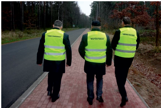
Powiat Starogardzki - Współpraca - Gmina Kaliska

Długo wyczekiwana, podnosząca jakość pod- rózowania i przede wszystkim bezpieczeństwo - nowa oświetlona ścieżka rowerowa w naszej gminie.