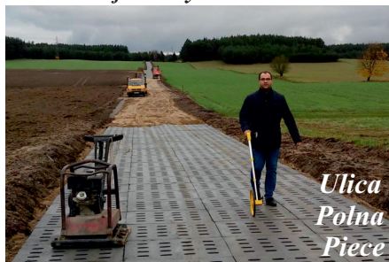
Ulica Polna Piece