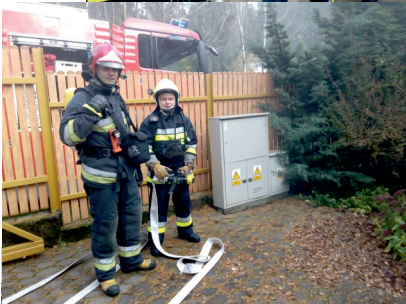
Materiały OSP Kaliska