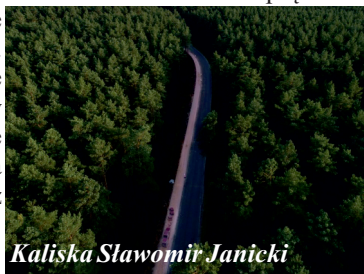
Wójt Gminy Kaliska Sławomir Janicki

Zarząd Powiatu po odbiorze przekazał gminie Kaliska w użytkowanie lampy typu LED. W związku z tym niezwłocznie wystosowaliśmy niezbędne dokumenty o zawarcie umowy z firmą Energa na zamontowanie liczników prądu i podłączenie oświetlenia. Obecnie oczekujemy na wykonanie podłączenia zgodnie z umową.