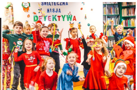
Materiały Gminna Biblioteka Publiczna