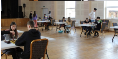
Materiały GOK Kaliska