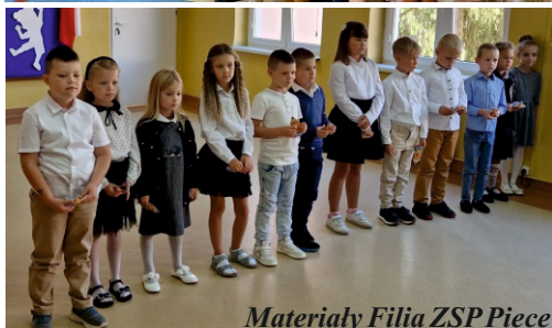
Materiały Filia ZSP Piec