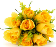
Jubilat Bogusław Ciecholewski 90 lat