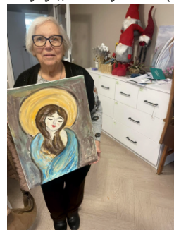
Materiały Klub Seniora w Piecach.