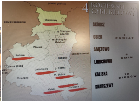
Materiały - Kociewski Cykl Biegowy