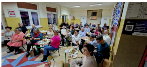
Materiały - Przedszkole w Piecach

Serdecznie dziękujemy Babciom i Dziadkom naszych uczniów za tak liczne przybycie oraz Rodzicom za pomoc w przygotowaniu poczęstunku, strojów i dekoracji.