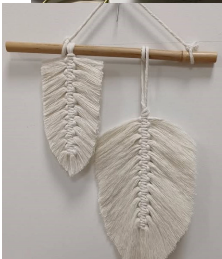
Materiały - GOK Kaliska