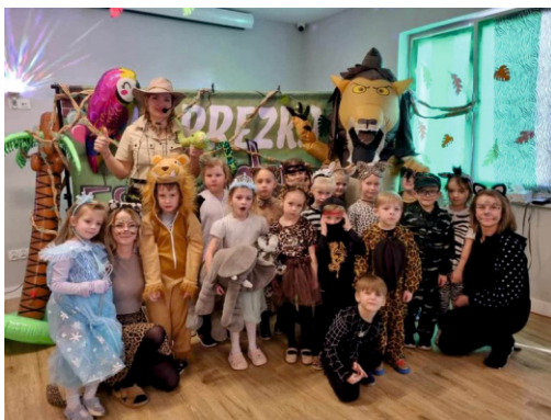
Materiały - Przedszkole w Kaliskach