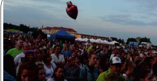
Publiczność dopisała - DZIĘKUJEMY ZA TAK LICZNE PRZYBYCIE !