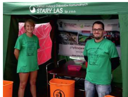
Segregacja odpadów z pracownikami firmy STARY LAS Sp.z o.o.