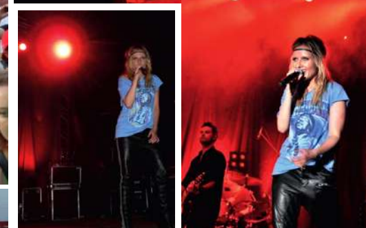
GWIAZDA WIECZORU - Patrycja Markowska