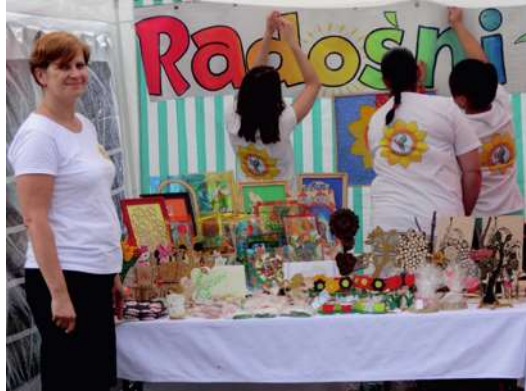
Prace ręczne Grupy „RADOŚNI” ze Środowiskowego Domu Samopomocy