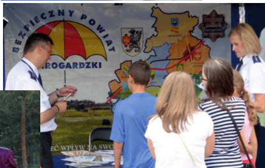
Zasady bezpieczeństwa z funkcjonariuszami KP Starogard Gd.