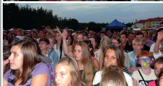
Wieczorny występ Zespołu - Najlepszy Przekaz w Mieście