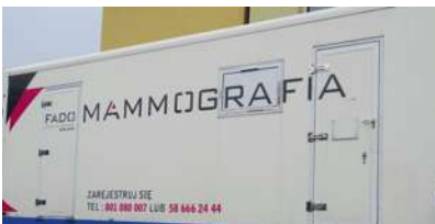
Możliwość badań mamograficznych