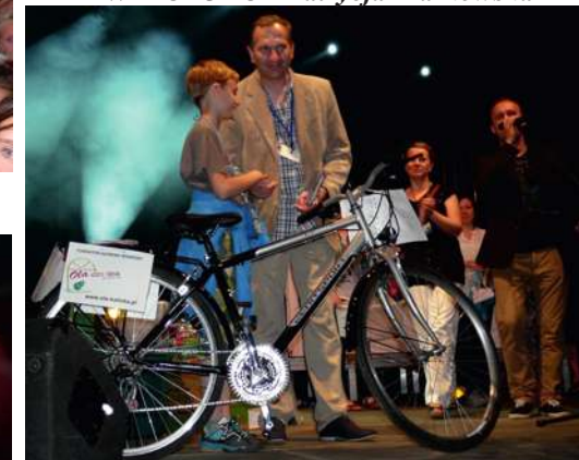
Główna Nagroda Loterii Fantowej - ROWER - ufundowała firma PPU „OLA” z Kalisk. Nagrodę Główną w Konkursie wiedzy o Kaliskach - ROWER - ufundowała firma EFIS z Piec.

Festyn Dni Kalisk- Lato na Kociewiu zrealizowany w ramach operacji pt: "Dni Kalisk-lato na Kociewiu-organizacja festynu gminnego w Kaliskach" w ramach programu, Osi 4 "Leader", działania 413, "Wdrażanie lokalnych strategii rozwoju" z zakresu małych projektów. „Europejski Fundusz Rolny na rzecz Rozwoju Obszarów Wiejskich: Europa inwestująca obszary wiejskie”.