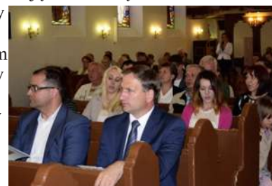
Materiały GOK Kaliska

Dziękujemy wszystkim uczestnikom za tak liczny udział i zapraszamy na kolejne spotkanie już za rok.