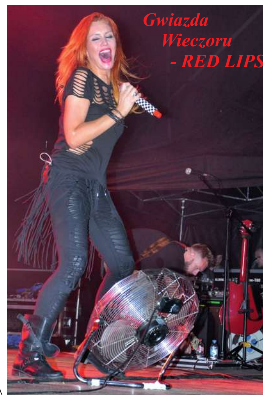
Gwiazda Wieczoru - RED LIPS

atrakcji oraz nieodzwonnej loterii fantowej, w której można było wygrać, między innymi, aż dwa rowery!