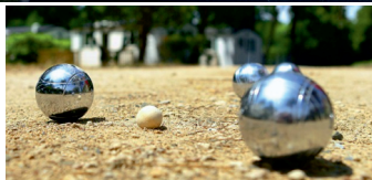
Materiały - Petanque Kaliska