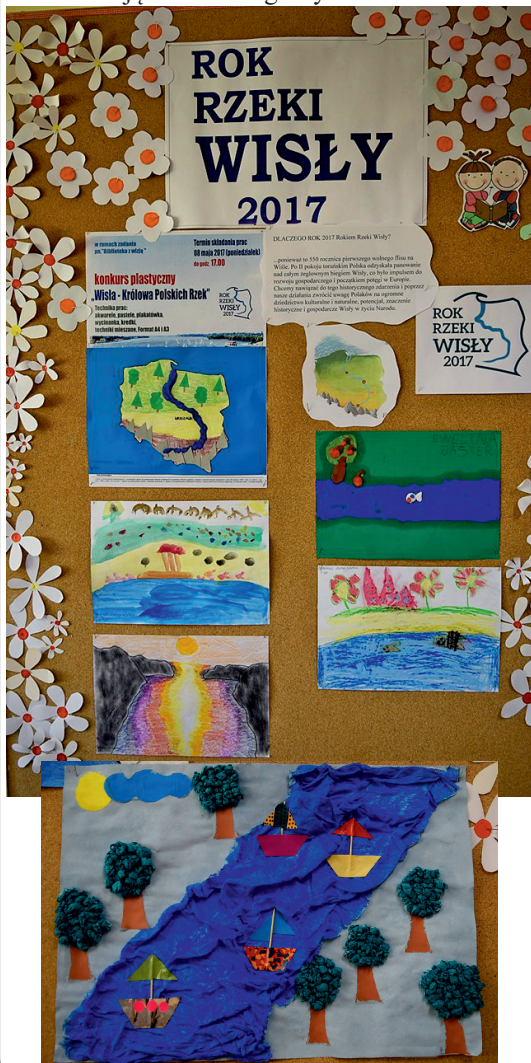
Zadanie dofinansowane ze środków Ministerstwa Kultury i Dziedzictwa Narodowego.

Prace, które otrzymałam były wykonane z ogromną starannością wyróżniały się sporą kreatywnością. Zachęcam bardzo wszystkie dzieci do udziału w naszych konkursach, na wszystkich czekają ciekawe nagrody!