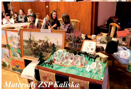
Materiały ZSP Kaliska