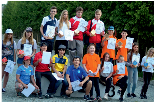
GRAND PRIX POLSKI W PETANQUE - JUNIORZY SUBKOWY 1.06.2019