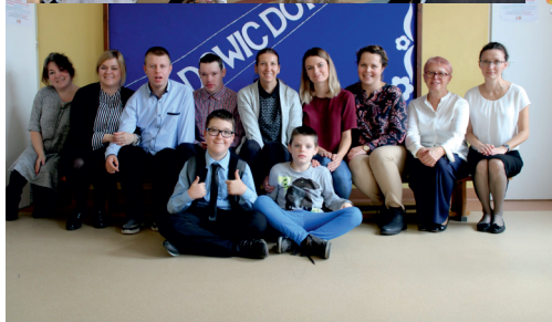
Materiały OREW w gminie Kaliska