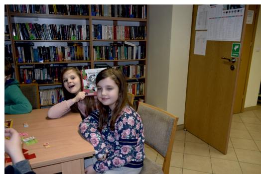
Materiały GOK Kaliska