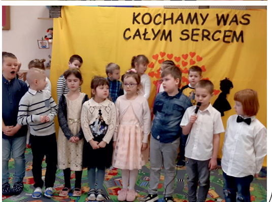
Materiały Przedszkole Kaliska