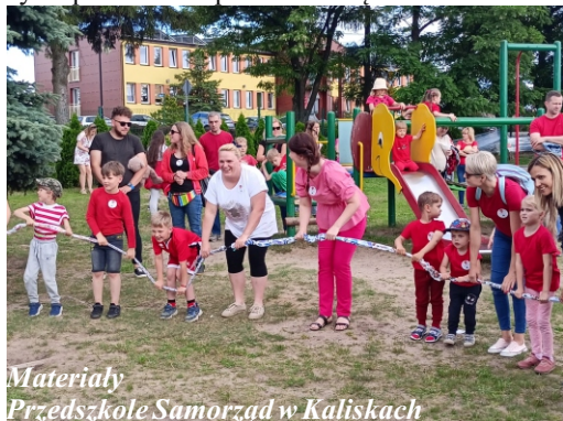
Materialy Przedszkole Samorząd w Kaliskach

Tegoroczny Truskawkowy Dzień Rodziny był naszym wielkim wspólnym sukcesem! Dzieci, rodziców i pracowników przedszkola pod każdym względem! Organizacyjnym, artystycznym, kulinarnym, towarzyskim i integrującym społeczność przedszkolną.