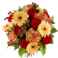
Jubilat Józef Rogaczewski 91 lat