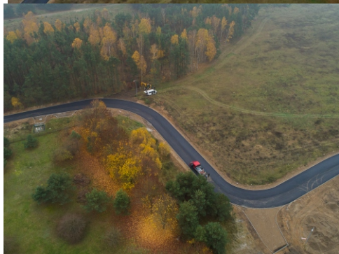
Zdjęcia z lotu ptaka