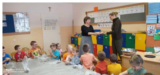
Materiały Publiczne Przedszkole w Piecach