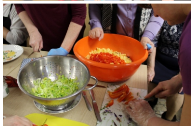
Materiały GOK Kaliska