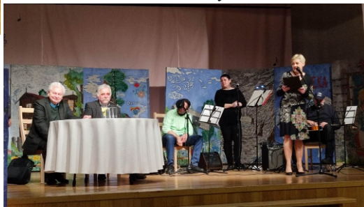
Materiały GOK Kaliska

"Gdański Sen" - Saga o Starszym Panu, jego ukochanej córce, zięciu i wnukach to opowieść na wpół magiczna, tocząca się przez kilkadziesiąt lat na tle Gdańska. Śledzimy w niej splecione losy polskich rodzin, zagubionych i odnajdujących się po wielu dekadach. Przeżywających chwile szczęścia i dramaty. Próbujących znaleźć swoje miejsce w zmieniającej się powojennej rzeczywistości.