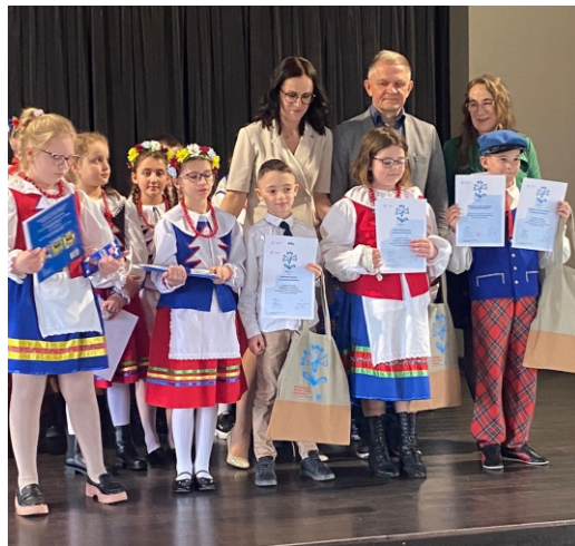
Materiały Przedszkole Samorządowe Kaliska