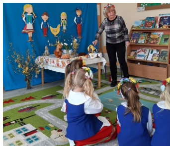
Materiały Samorządowe Przedszkole w Kaliskach