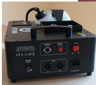
Materialy OSP Kaliska