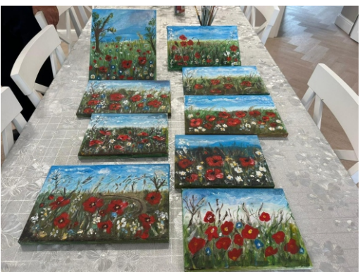
Materiały - Klub Seniora w Piecach