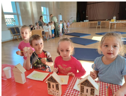
Materiały GOK Kaliska

Dofinansowano w ramach programu "Działaj Lokalnie" Polsko - Amerykańskiej Fundacji Wolności realizowanego przez Akademię Rozwoju Filantropii w Polsce oraz Lokalną Grupę Działania "Chata Kociewia" ze środków Zakładów Farmaceutycznych Polpharma S. A.