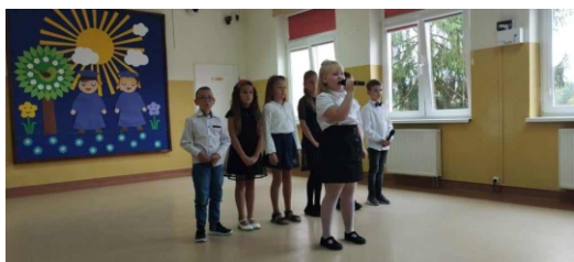
Materiały Szkoła Podstawowa Filia Piece