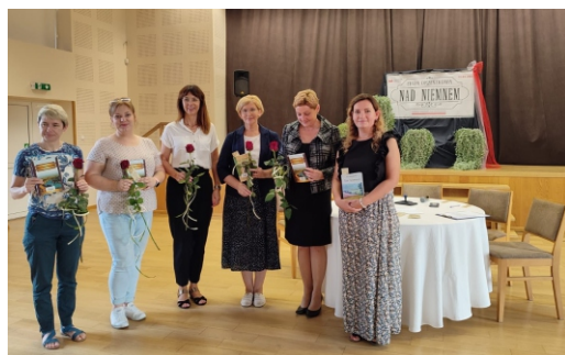
Materiały GOK Kaliska