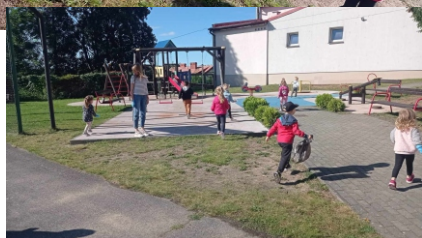
Materiały Przedszkole Piece