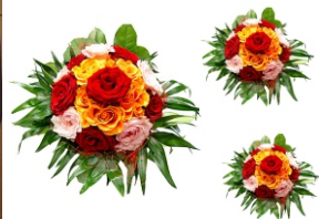
Jubilatka Gertruda Orlikowska 90 lat