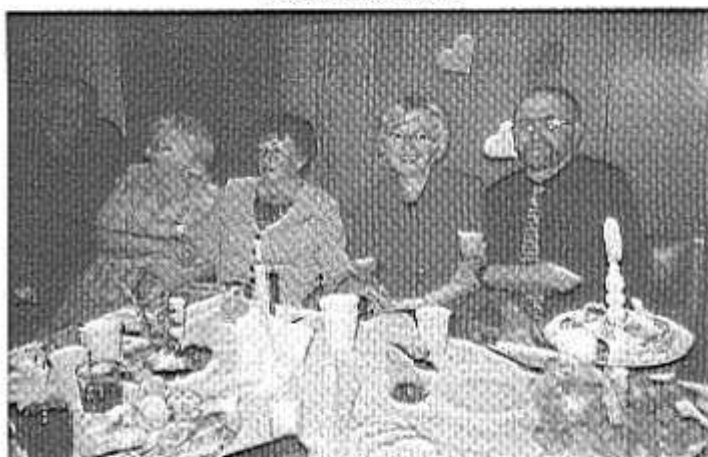
Przy stole biesiadnym.

Urząd Gminy Kaliska oraz Gminny Ośrodek Kultury w Kaliskach zapraszają na Turniej Sołectw 20 listopada 2004 r. o godz. 16.00 MIEJSCE: SALA WIDOWISKOWA GOK w Kaliskach