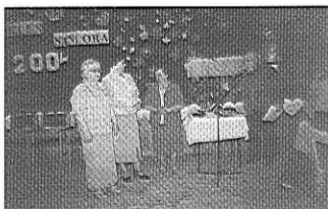
Wyróżnienie członków koła przez Przewodniczącego Rejonu PZERI w Starogardzie Gdańskim.