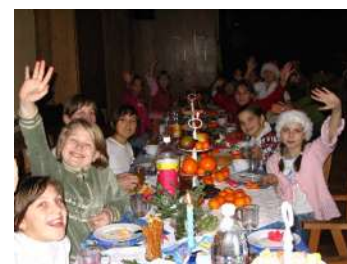
Spotkanie dzieci z gminnych świeclic terapeutycznych 21.12.2006

Kilka fotek z Jasełek i kiermaszu noworocznego w Przedszkolu w Kaliskach 20.12.2006