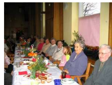
Spotkanie Związku Emerytów, Rencistów i Inwalidów 16.12.2006

Spotkanie członków „Wspaniałe j Rodzinki” oraz gości 12.12.2006