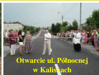
Otwarcie ul. Północnej w Kaliskach