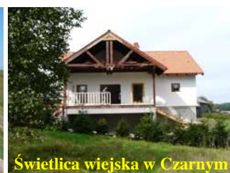
Świetlica wiejska w Czarnym