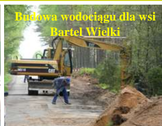
Budowa wodociągu dla wsi Bartel Wielki