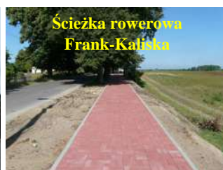
Ścieżka rowerowa Frank-Kaliska