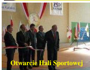
Otwarcie Hali Sportowej