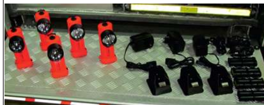
Latarki kątowe - 5 szt.

„ Survivor LED „ wraz z ładowarkami - 3 szt.