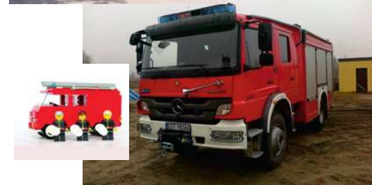
Zarząd OSP w Kaliskach