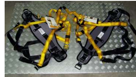
Szelki ratownicze - 2 kpl - asekuracja ratowników pracujących na wysokości