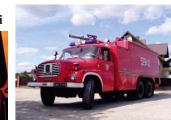
Taki samochodzik mieliśmy, a taki doposażyliśmy. :-)