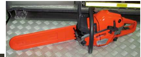
Pilarka do drewna

Sprzęt pozyskany z innych źródeł finansowych: