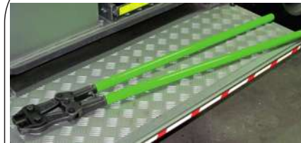
Nożyce do cięcia drutu „16 mm”