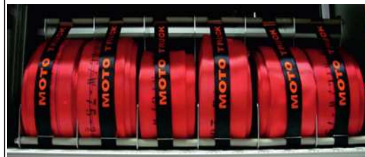
Węże pożarnicze W-75 i W- 52